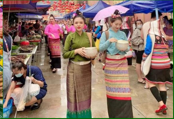
วันที่สาม หมู่บ้าน โบราณสมัยอาณาจักรหอคำเชียงรุ่ง