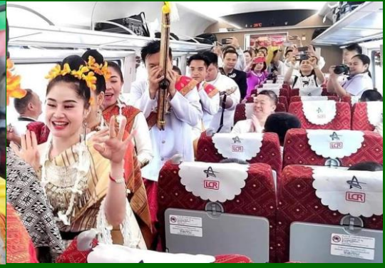
วันที่หก เก็บความประทับใจของเส้นทางลาวจีน